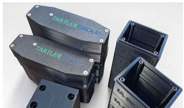
Im Fused Deposition Modelling kann TARTLER schnell und kostengünstig Hilfsmittel und Bauteile fertigen, die die Qualität der betrieblichen Abläufe erheblich verbessern.