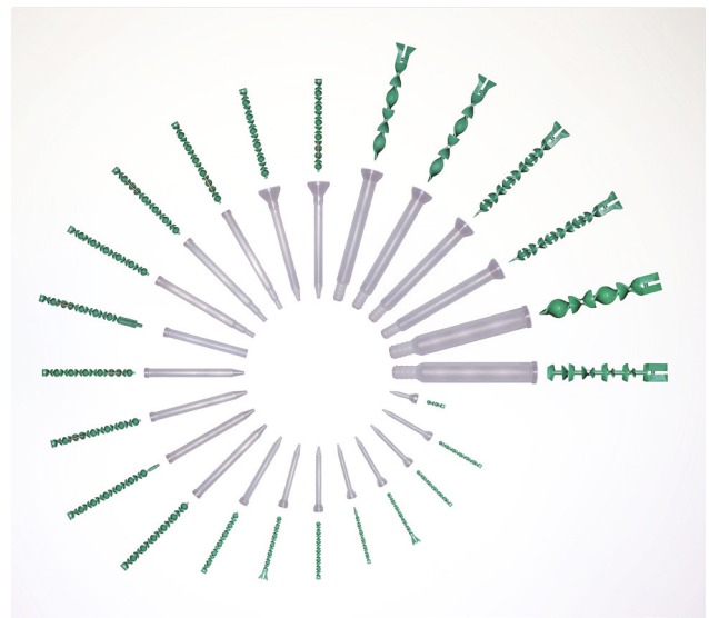
„Mischen is possible“: TARTLER entwickelt und fertigt für nahezu jedes Szenario der Kunstharz-Verarbeitung den optimalen Einwegmischer.

Grundsätzlich zeichnet sich die Arbeit von TARTLER durch ein hohes Maß an Innovationsfreude und Kundenorientierung aus. Das zeigt sich nicht nur am Einsatz der Additiven Fertigungsverfahren und an der regelmäßigen Vorstellung neuer Lösungen für die Kunstharz-Verarbeitung, sondern auch an einem wachsenden Angebot an Serviceleistungen wie etwa die Fernwartung, die Ersatzteilversorgung, den Wartungs- und Umbauservice oder den Site Acceptance Test (SAT), der zum Einsatz kommt, wenn die Inbetriebnahme einer Maschine direkt vor Ort beim Anwender erfolgt.