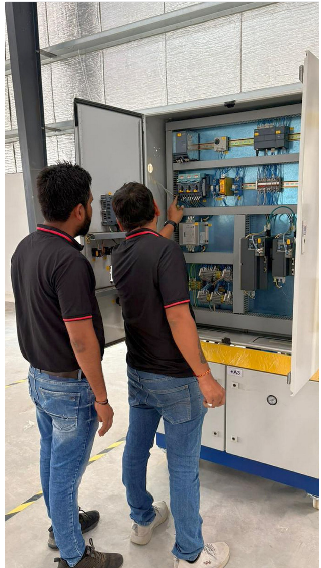
Am neuen Standort von TARTLER India in Ahmedabad beginnen die Mitarbeiter derzeit mit der Endmontage der ersten Dosier- und Mischmaschinen für die Kunststoffverarbeitung.