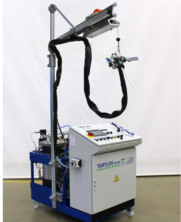
Inklusive Mischkopf-Balancer: TARTLER stimmt fast jede MDM plus auf die Wünsche der Kunden ab – bei Bedarf auch mit handhabungstechnischer Peripherie.

Des Weiteren lässt es die Bauweise der Kompaktanlage zu, elektrische oder pneumatische Rührwerke für die Komponenten einzusetzen und die B-Komponente durch einen Silikagelfilter zu führen. Und: Der Anwender kann mit der MDM plus kleine Rezirkulationen durchführen. Hierbei wird unvermishtes Material in Dosierpausen durch die Pumpen und – falls vorhanden – durch den Volumenstromzähler zurück in die Be-