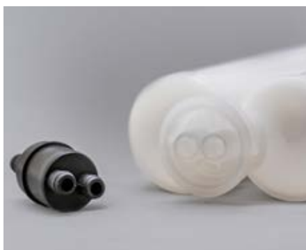
Die verschiedenen, austauschbaren Adapter ermöglichen die Nutzung unterschiedlicher Kartuschen