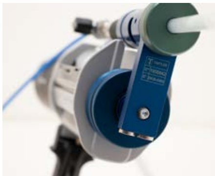
Der Kartuschenmischer wird auf an einer vorhandene Pistole angebracht