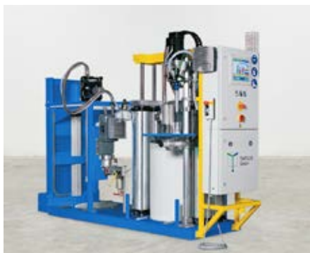
Ausführungsbeispiel einer TARDOSIL mit 200 l Behälter (A) und 30 l Drucktank (B) mit autom. Nachfüllung