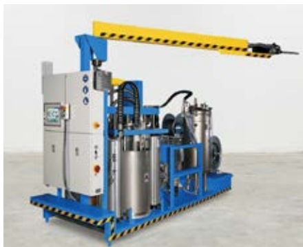
Ausführungsbeispiel einer volumenstromgeregelten TARDOSIL mit autom. Nachfüllung für A und B