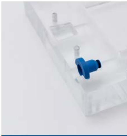
Flowstop in offene Form einlegen, anschließend wird die Form wieder verschlossen.

Der kostengünstige Einwegartikel muss im Vergleich zu anderen Verschlussmöglichkeiten (z.B. Klappen oder Schieber) weder gereinigt noch gewartet werden.