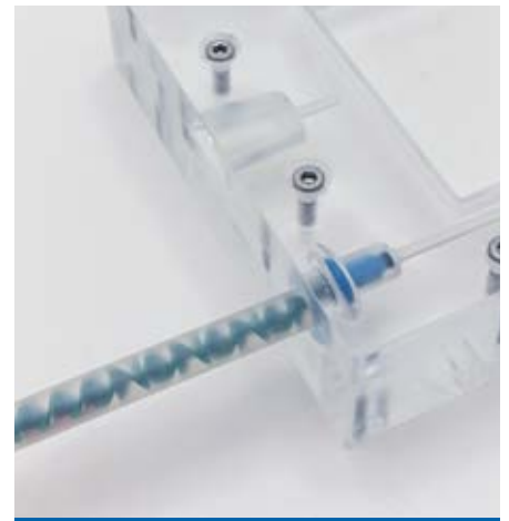
Die Befüllung der Form kann gestartet werden. Durch den Materialfluss öffnet sich der Flowstop.