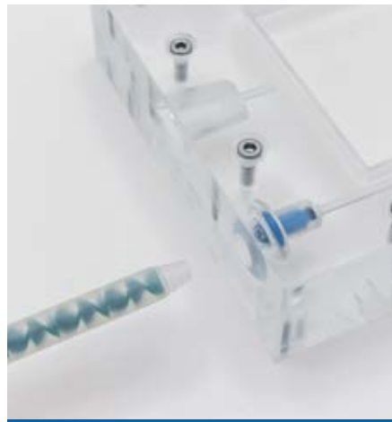
Die Mischerhülse wird vorne gekürzt und soweit in den Flowstop gesteckt, bis sie auf Widerstand stößt.