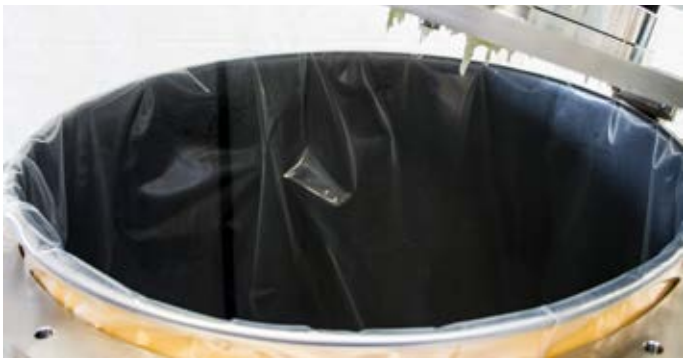
Vakuumpannfass mit Inliner vor dem Einschalten der Vakuumpumpe Vacuum drum with inliner before switch-on the vacuum pump

Subject to technical changes without prior notice.