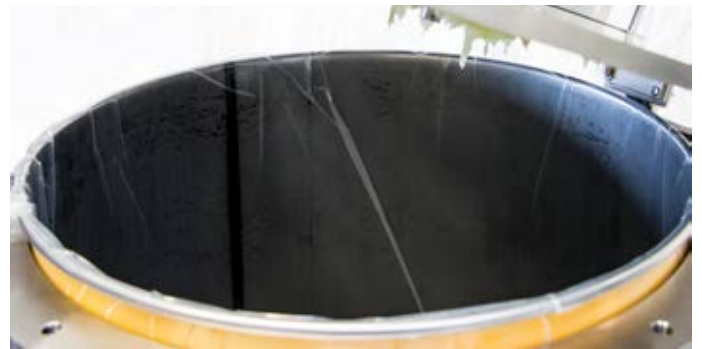
Inliner liegt durch hergestelltes Vakuum am Fass an Due to generated vacuum the inliner fits closely to the drum