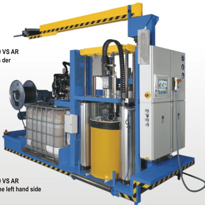
Tardosil 200 VS AR view from the left hand side